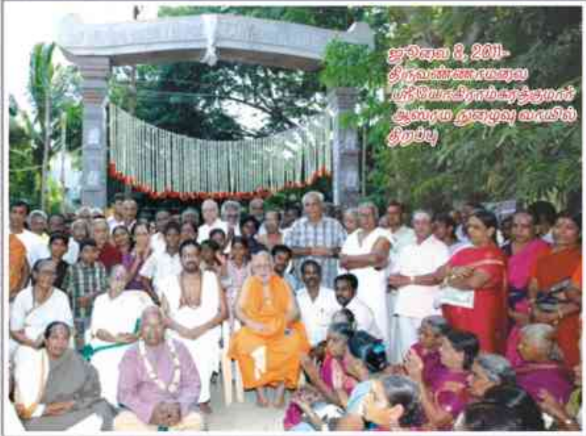
ஜூலை 8, 2011 - திருவாரூர் ஊராட்சி மதுராசபட்டினம் ஆஸ்ரமம் ஆஸ்ரம குழுவுக்கு விருந்து தர்ப்பு