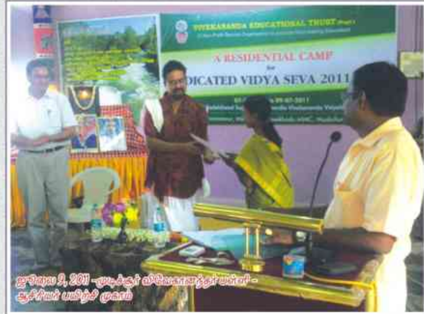
ஜூலை 9, 2011 -ஹைதராபாட் விவேகானந்தர் பள்ளி - சூப்பிரியட் யசிந்தி முகாம்