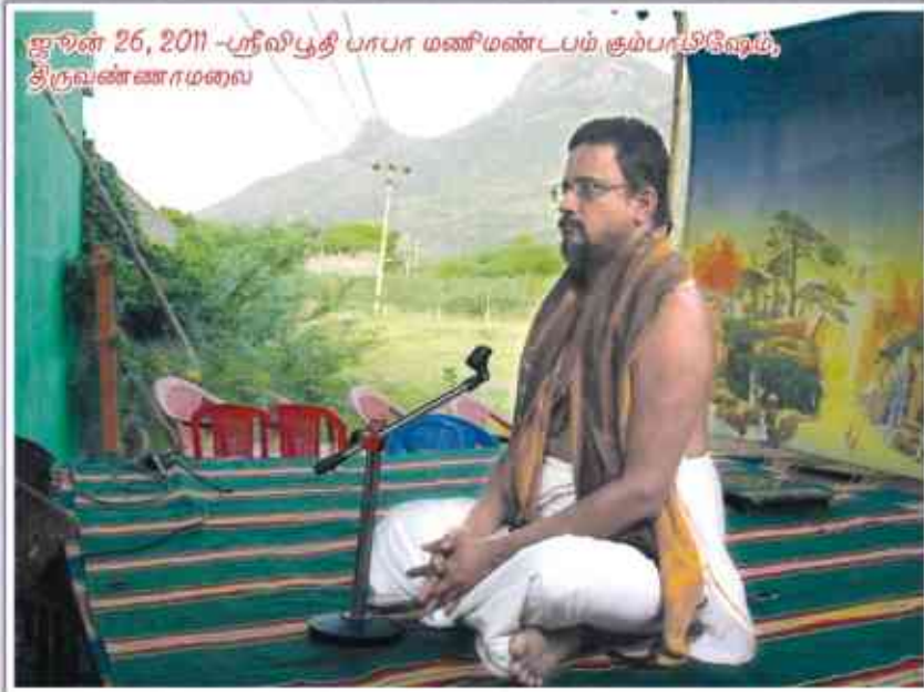
ஜூன் 26, 2011 -ஸ்ரீவிசுதி பாபா மணிமண்டபம் சூம்பாடிநேரம், திருவண்ணாமலை