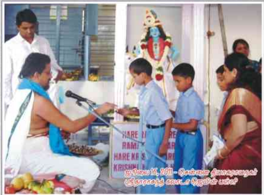
ஜூலை 16, 2011 - சென்னை தியாகராஜன் ஸ்ரீகுமாரன்ந்த் கலாடா டிஜிபிள் பள்ளி