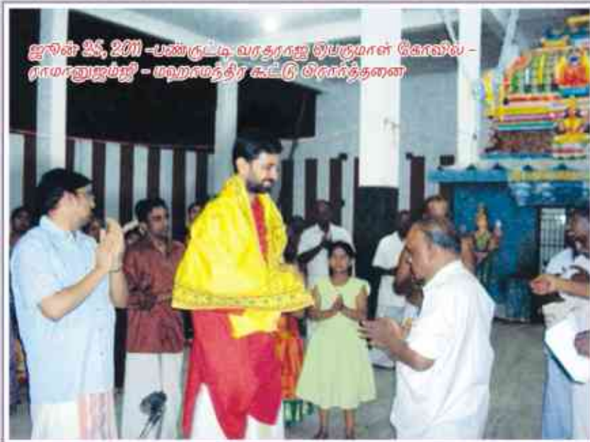
ஜூன் 26, 2011 -பண்டிட வரதராஜ ஓபருமாள் கோவில் - நாமனாஜம்ஜி - மஹாமத்திர கூட்டு பிரார்த்தனை