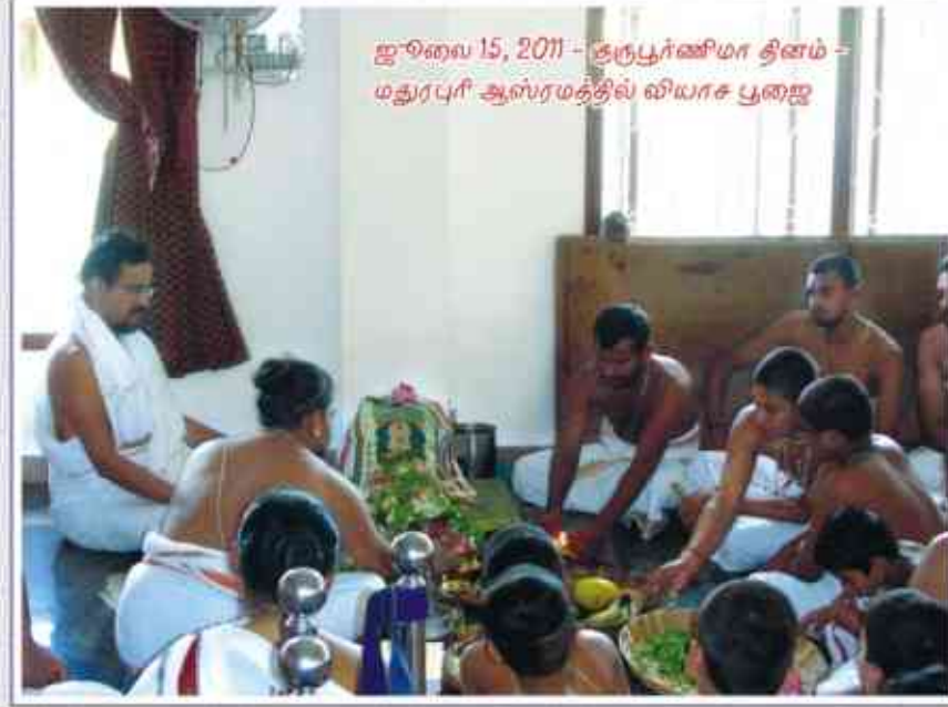
ஜூலை 15, 2011 - திருப்பூர் ஊராட்சி நிர்வாகம் - மதுராசபட்டினம் ஆஸ்ரமத்தில் விருந்தினர் பூஜை